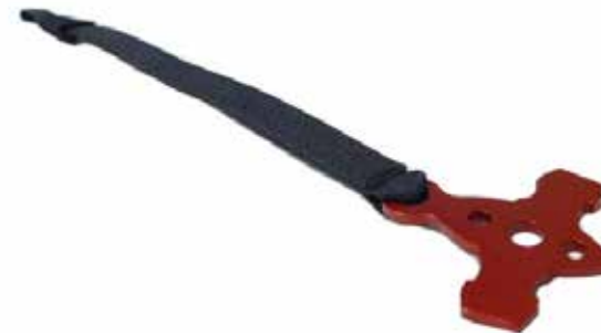
Nuevo "kit anti-olvido"