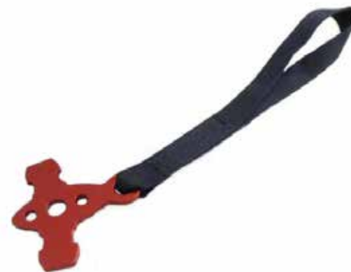
Nouveau "kit anti-oubli" pour DELIGHT 2

Cette notice vous permettra de réaliser la réparation de votre sellette suite à la parution de la safety note "Ouverture de la boucle automatique ventrale en vol"