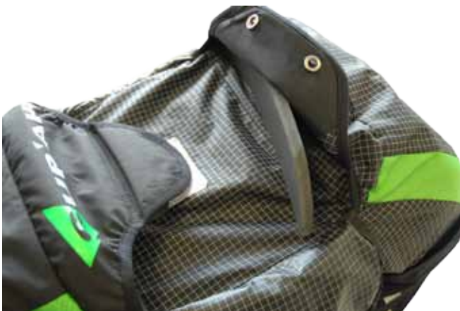
b. Glisser la plus fine cale (B) dans le flap inférieur de la poche parachute.