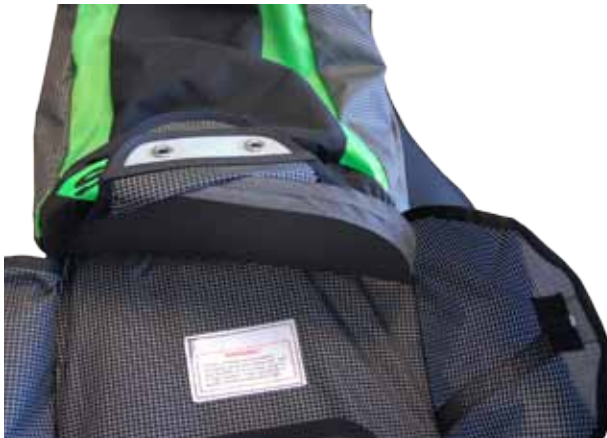
a. Glisser la plus large cale (A) dans le flap supérieur de la poche parachute.

Le Kit envoyé par le SAV SUPAIR contient deux cales : la plus grosse (cale A) sera installée dans le flap du haut de la poche parachute. La plus petite, (cale B) sera installée dans le flap du bas.